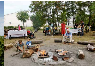
Feuerstelle und Grillplatz